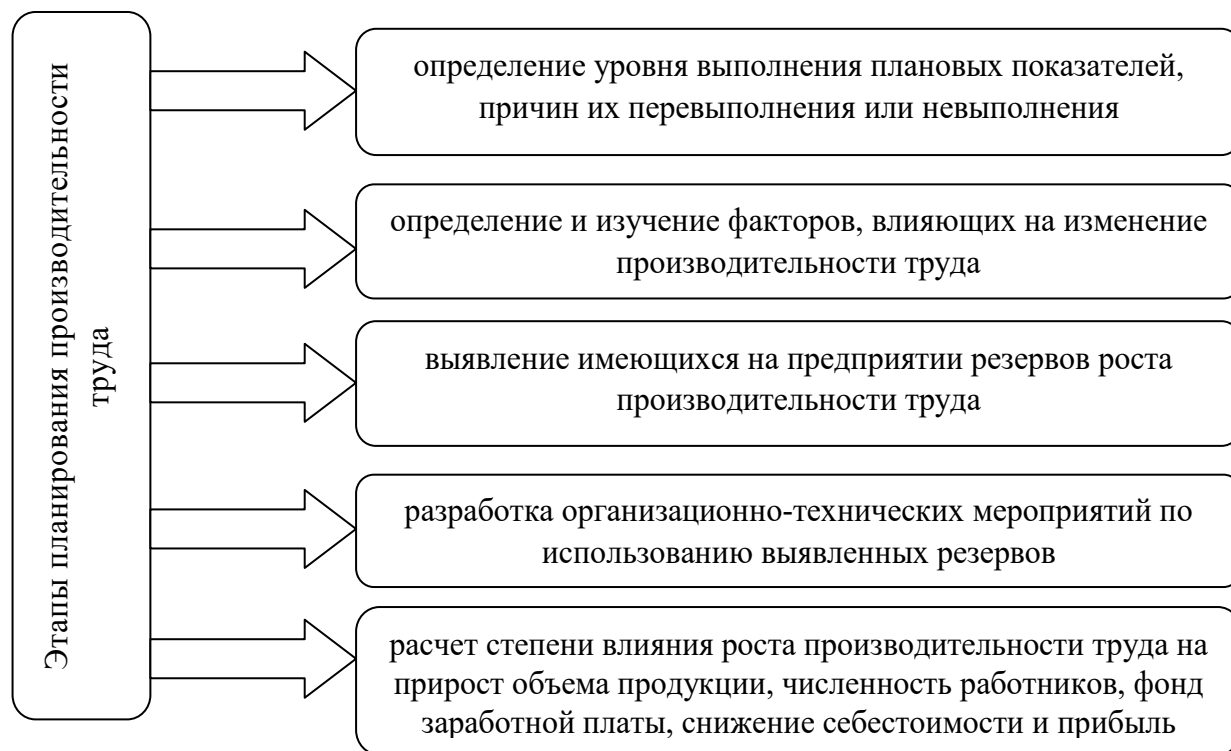
Рис. 1. Этапы планирования производительности труда*

Этапы планирования производительности труда можно представить в виде схемы на рис.1. Необходимо уточнить, что на всех этапах, обозначенных при помощи рис.1, руководству необходимо осуществлять контрольные мероприятия с целью недопущения использования различий в основных показателях, используемых при планировании производительности труда. Кроме того, все показатели должны иметь сопоставимые единицы измерения.