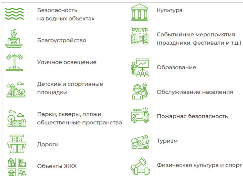
Рис. 2. Направления, по которым могут быть реализованы проекты инициативного бюджетирования*

На рисунке 2 представлены направления, по которым могут быть реализованы проекты инициативного бюджетирования.